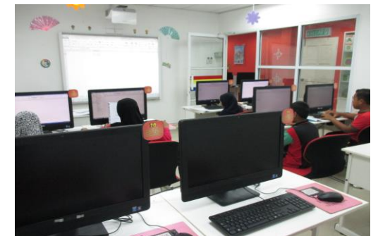
Peserta sedang mengikuti kelas Microsoft Excel