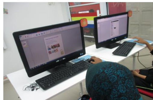
Peserta sedang mengikuti kelas tutorial