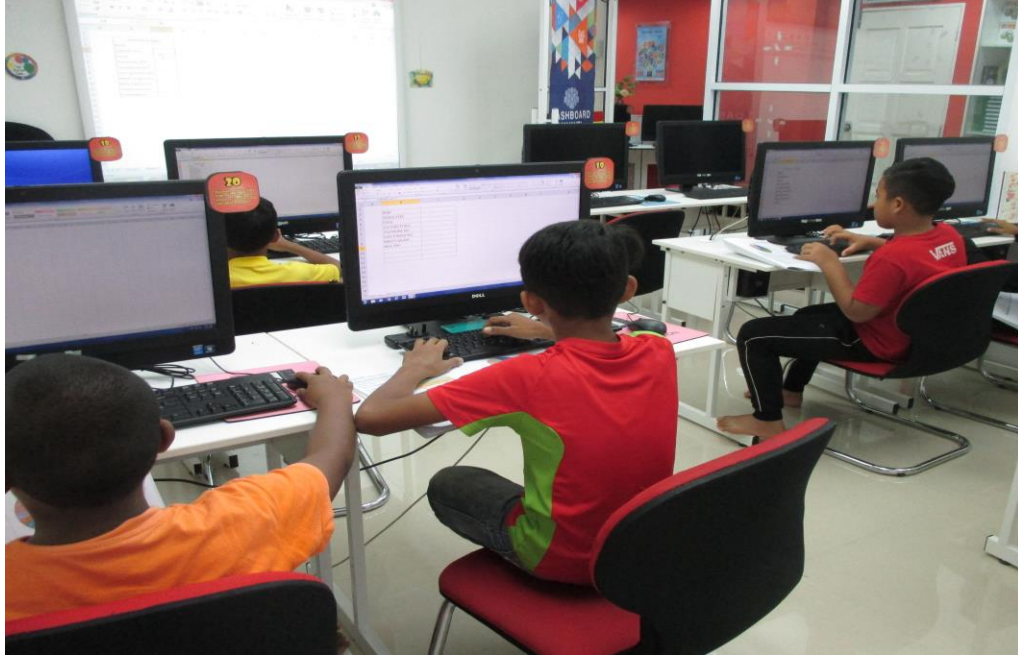
Peserta yang menyertai kelas ILES