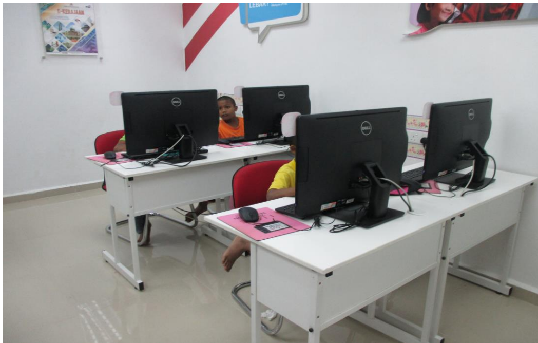
Peserta yang menyertai kelas ILES