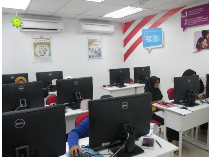
Peserta menyertai kelas INTEL