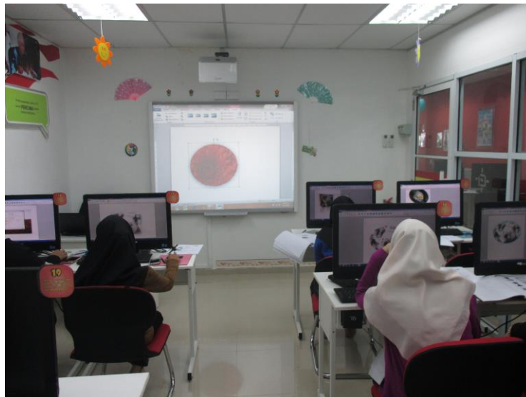
Peserta sedang mengikuti kelas