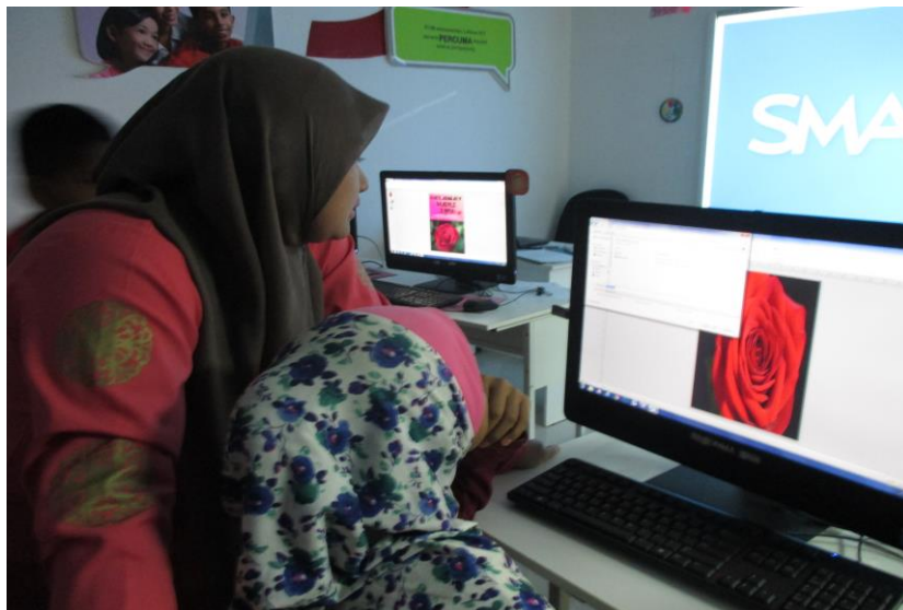
Petugas sedang memberi tunjuk ajar