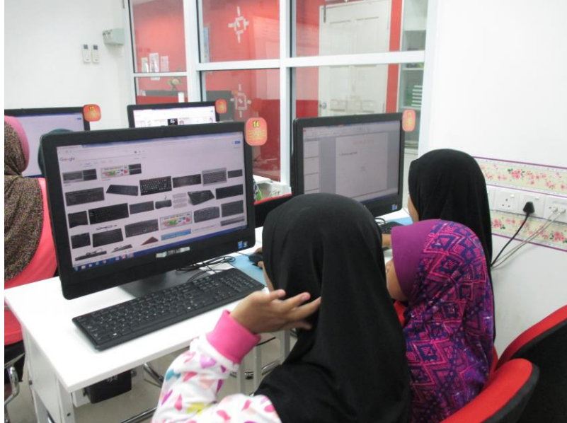
Peserta sedang mengikuti kelas Microsoft Office