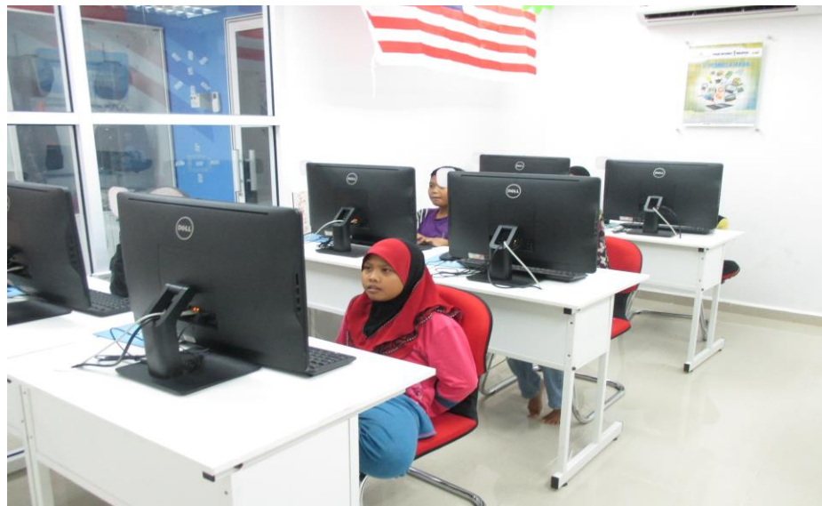
Peserta yang menyertai kelas ILES