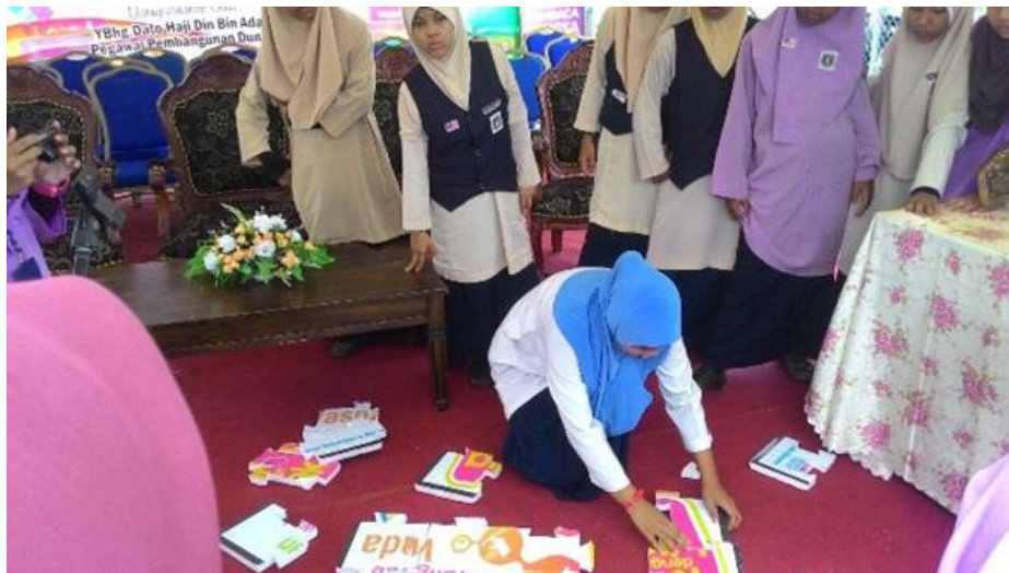
Peserta pertandingan Puzzle Gergasi