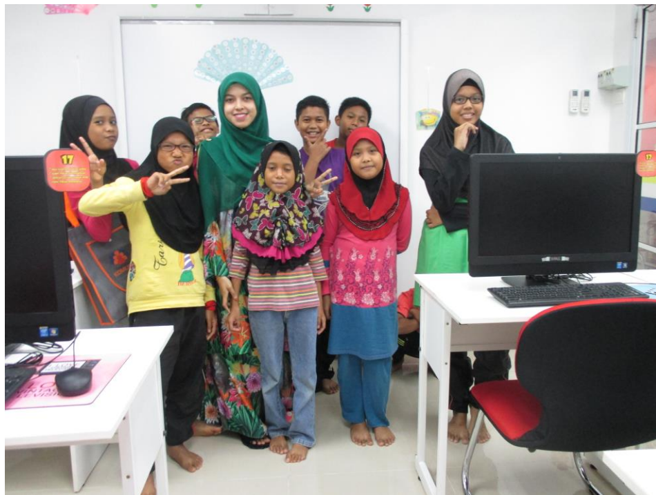
Penutup kelas INTEL