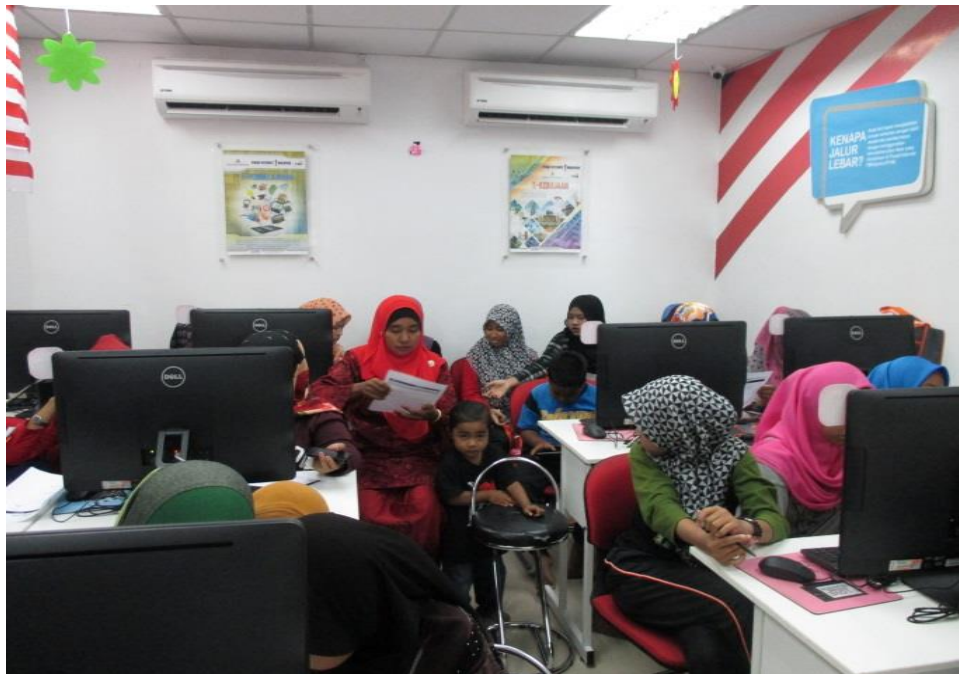
Pengunjung yang hadir program MyShop