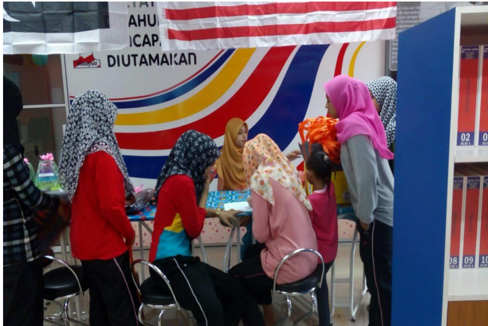
Pendaftaran Keahlian & kedatangan program MyShop