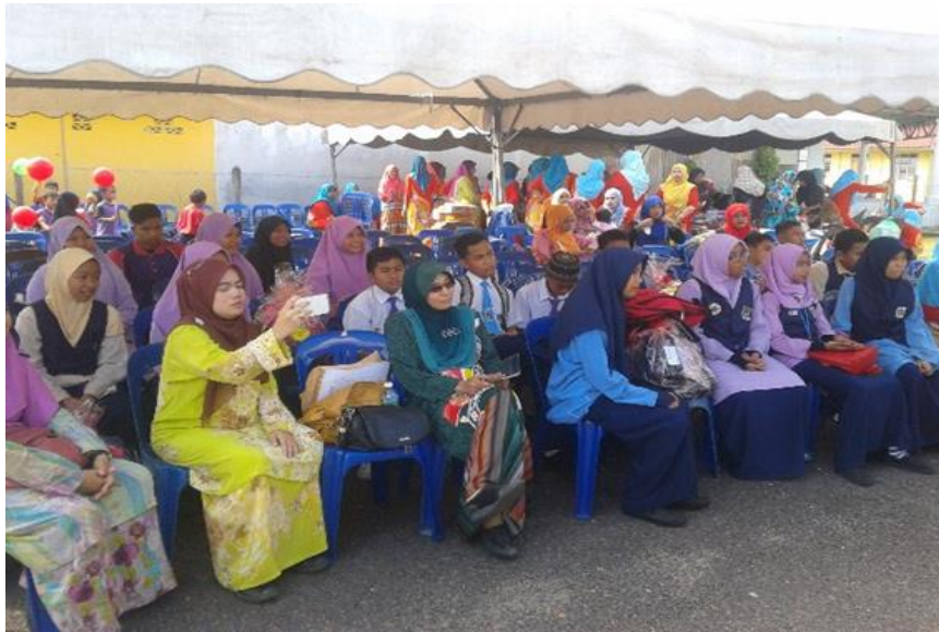
Peserta mendengar penerangan dashboard komuniti dan Klik Dengan Bijak