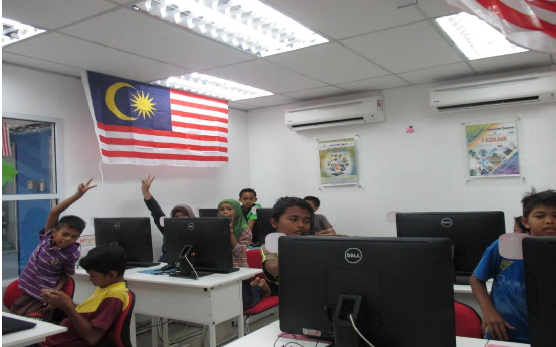
Peserta sedang mengikuti kelas