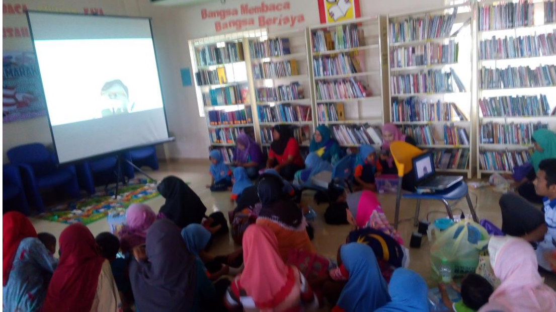
Program Semarak Merdeka di Perpustakaan Desa Pulau Serai