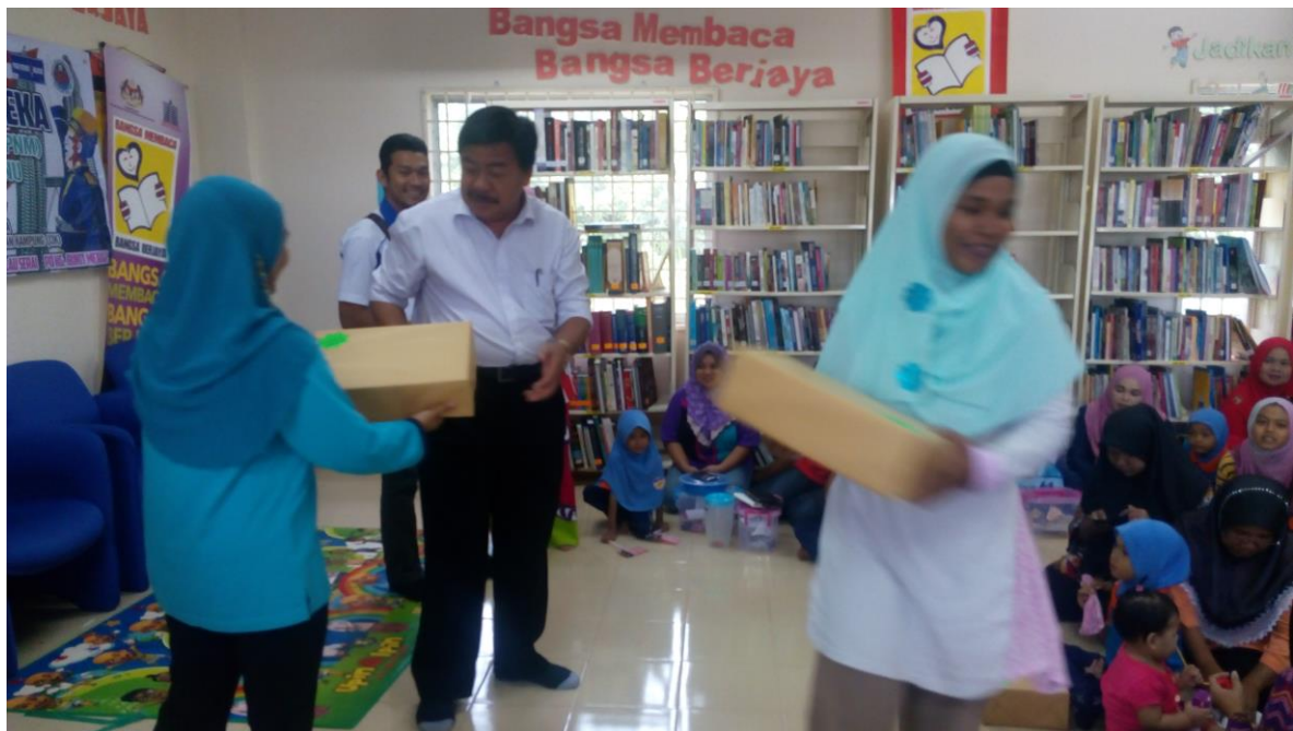
Sesi pembahagian hadiah